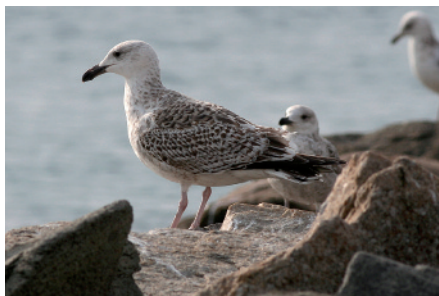
Gavinot Larus marinus , Port de Palamós, Palamós (Alt Empordà), 4.II.2007 (Ferran López).

2005 BAIX EBRE. El Goleró, Deltebre, delta de l'Ebre. Hi ha fotografies. 1 ex. de primer hivern. 15 de febrer (David Bigas).