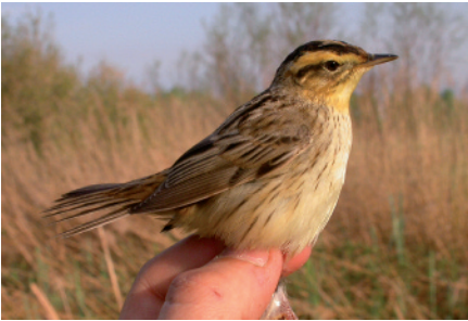
Boscarla d'aigua Acrocephalus paludicola , estanys de Palau, Parc Natural dels Aiguamolls de l'Empordà (Alt Empordà), 10.IV.2006 (Sergi Sales).

2006 ALT EMPORDÀ. Estanys de Palau, Palau-saverdera, Parc Natural dels Aiguamolls de l'Empordà. Capturat per anellament. Hi ha fotografies. 1 ex. d'edat indeterminada. 10 d'abril (Sergi Sales).