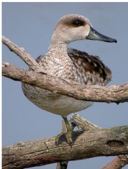
Xarxet marbrenc Marmaronetta angustirostris , Maresma del Remolar, Delta del Llobregat (Baix Llobregat), Maig 2006 (Xavier Martínez).

2004 BAIX LLOBREGAT. Maresma del Remolar-Filipines, Reserves Naturals del Delta