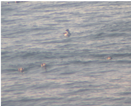
Gavotí Alle alle , platja de Viladecans, delta del Llobregat (Baix Llobregat), 19.XI.2006 (César Castel).

La de 1991, és la primera citació d'aquest taxó que homologa el CAC, i va suposar la seva incorporació a la Llista Patró (Clavell et al. 2006). La dada de 2006, però, va suposar una sorpresa, ja que l'observador tenia una foto que permet una identificació segura, sense que la notícia hagués circulat en el moment de l'observació per desconeixement de la importància del registre. Això confirma un cop més que cal que els observadors s'animin a enviar dades documentades encara que tinguin dubtes de les identificacions, ja que de