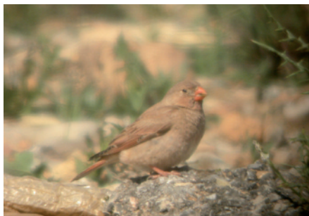
Pinsà trompeter Bucanetes githagineus , riu Besòs, Santa Coloma de Gramenet (Barcelonès), 26.IV.2005 (Xavi Larruy).

Aquesta és la primera citació d'aquest taxó que homologa el CAC, i va suposar la seva incorporació a la Llista Patró (Clavell et al. 2006). Malgrat que el lloc de la dada pugui fer pensar, d'entrada, en un possible origen artificial, aquest registre es tracta molt probablement d'una arribada natural, ja