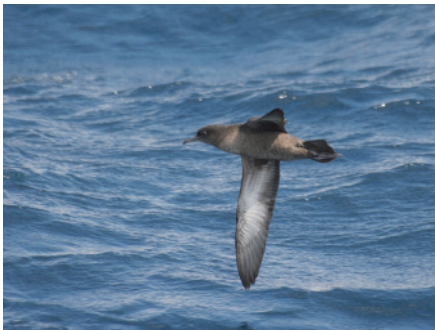
Baldriga grisa Puffinus griseus , Parc Natural de Cap de Creus (Alt Empordà), 31.III.2007.

Interessant observació d'una espècie que presenta un patró molt poc clar quant a la seva fenologia a Catalunya. Aquesta dada podria correspondre a un migrant postnupcial, donat que nidifiquen a l'estiu austral, començant la cria a l'octubre. No obstant, com que també hi ha dades prèvies (tot i que no homologades) de mesos tan diferents com ara gener, abril, març i maig (Paterson 1997), sense comptar les poques que s'han produït a la tardor, encara fal-