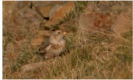
Sit blanc Plectrophenax nivalis , Tregurà, Vilallonga de Ter (Ripollès), 20.XI.2005 (Oriol Clarabuch).

2007 MARESME. Premià de Mar. Hi ha fotografies. 1 ex. mascle d'edat indeterminada. 30 de novembre (Jaume Castellà Torrents).