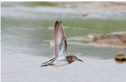
Territ pectoral Calidris melanotos , platja de ca l'Arana, Delta del Llobregat (Baix Llobregat), 13.VIII.2008 (Ferran López).

Primera citació homologada pel CAC d'aquest taxó, que ja figurava a la Llista Patró degut a les dades homologades pel CR-SEO. A França se'n coneixen citacions d'almenys 342 exemplars, i al conjunt d'Es-