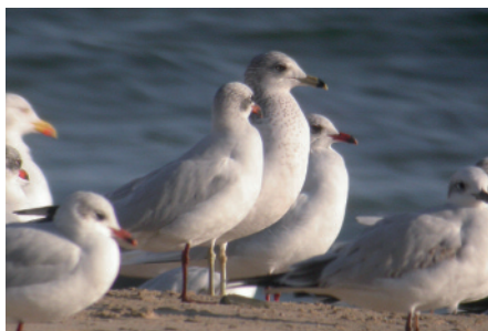
Gavina de Delaware Larus delawarensis , Platja de Cambrils, Cambrils (Baix Camp), 9.II.2006 (Vittorio Pedrocchi).

2006 BAIX CAMP. Platja al nord de Cambrils, Cambrils. Hi ha fotografies. 1 ex. de segon hivern. 9 de febrer (Vittorio Pedrocchi).