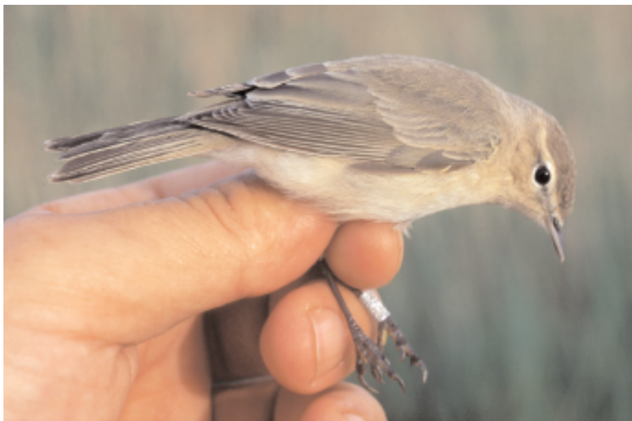
Mosquiter comú siberià Phylloscopus collybita tristis , Canal Vell, delta de l'Ebre (Baix Ebre), 22.IV (David Bigas).