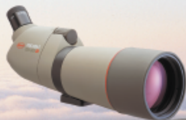
Serie TSN-660, 60mm Ø