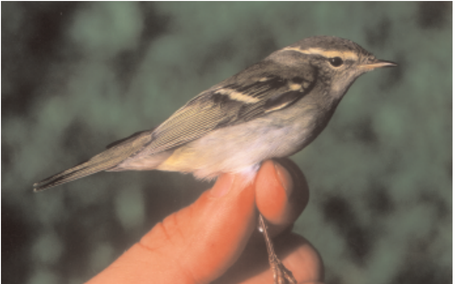
Mosquiter de doble ratlla Phylloscopus inornatus , can Jordà, Santa Pau (Garrotxa), 1.XI (Oriol Clarabuch).