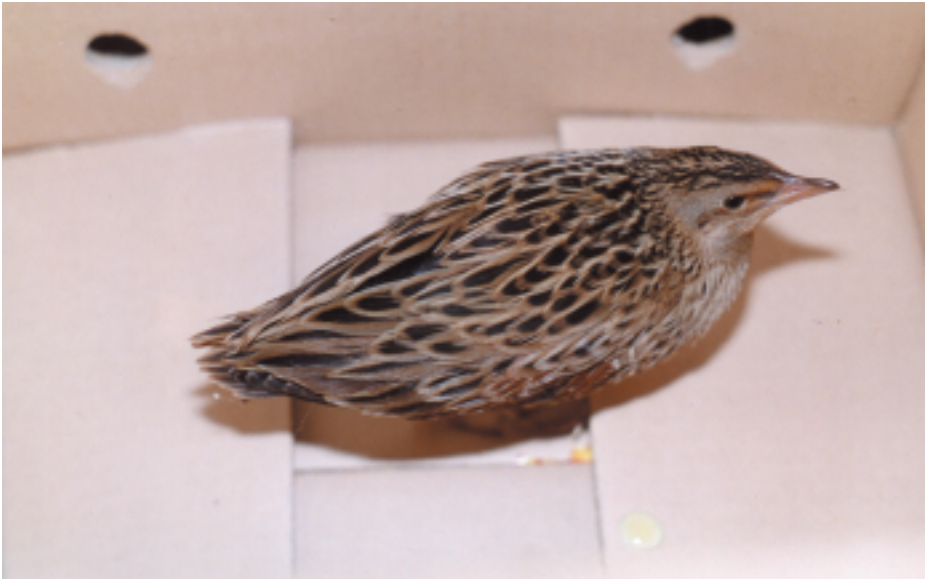
Guatlla maresa Crex crex , Avià (Berguedà), 4.IX (Lluís Cabanas).