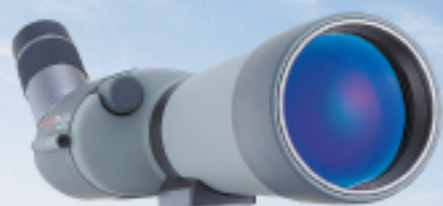
Serie TSN-820, 82mm Ø