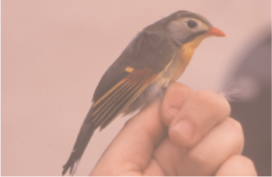
Rossinyol del Japó Leiothryx lutea , P. Collserola (Barcelonès) maig de 2000 (Sergi Sales).