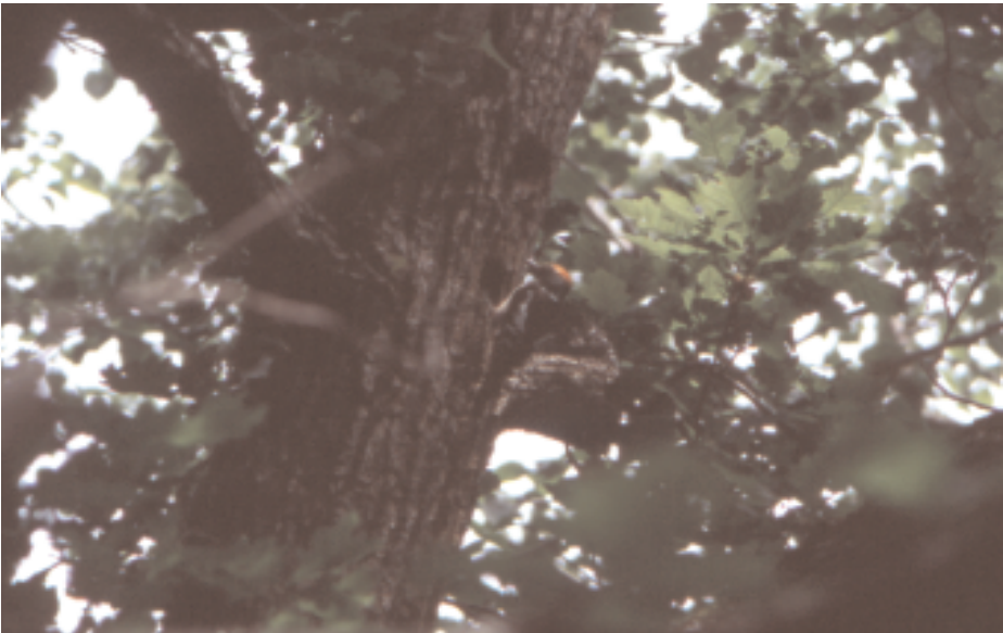
Picot garser mitjà Dendrocopos medius , Bausen (Val d'Aran), 23.V (Julio Pérez).