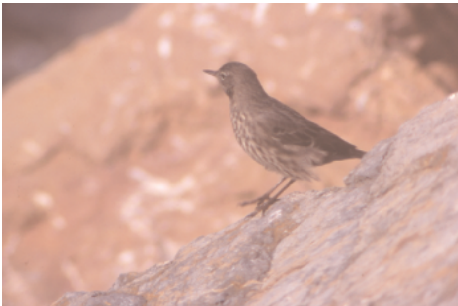
Grasset de costa Anthus petrosus , l'Estartit, Torroella de Montgrí (Baix Empordà), febrer de 2000.