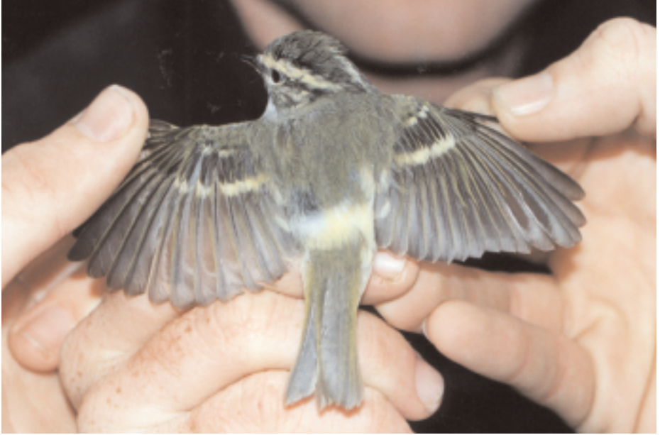
Mosquiter reietó Phylloscopus proregulus , Parc del Guinardó, Barcelona (Barcelonès), 8.IV (Juan Bécares).