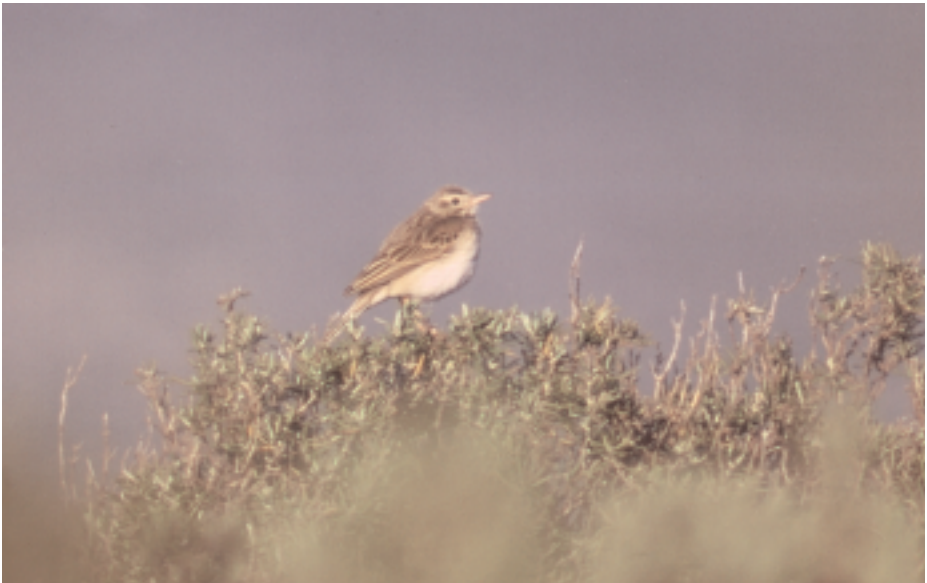
Piula grossa Anthus richardi , Massís del Montgrí (Baix Empordà), gener de 2000 (Daniel Burgas).