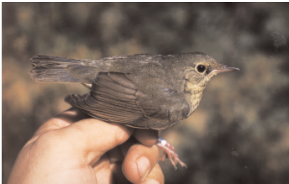
Rossinyol blau siberià Luscinia cyane , Canal Vell, delta de l'Ebre (Baix Ebre), 18.X (David Bigas).