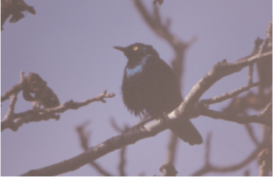
Estornell metàl·lic gran d'orelles blaves Lamprotornis chalybaeus , Vic (Osona) maig de 2001.