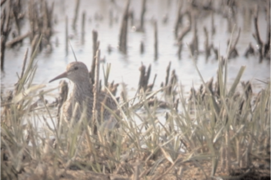
Territ pectoral Calidris melanotos , Port del Fangar, delta Ebre (Baix Ebre), 10.VII (Ricard Gutiérrez).