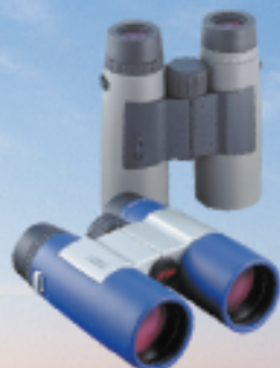
Prismáticos con corrección de fase, 42 y 25mm Ø