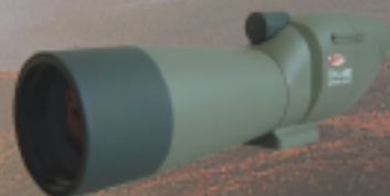
Serie TSN-600, 60mm Ø