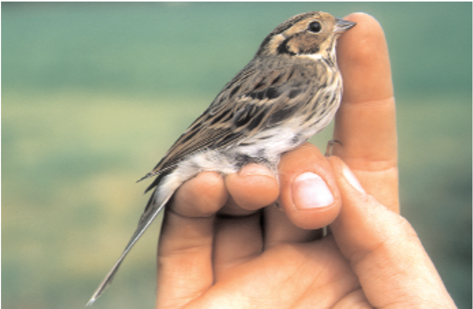
Repicatalons petit Emberiza pusilla , riu Segre, la Seu d'Urgell (Alt Urgell), 26.X (Jordi Dalmau).