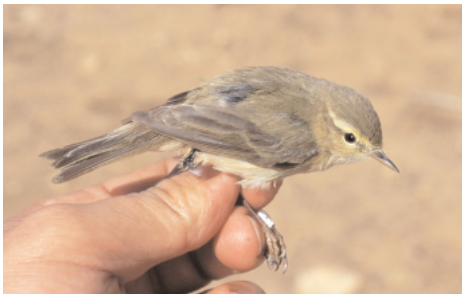
Mosquiter ibèric Phylloscopus ibericus , Canal Vell, delta de l'Ebre (Baix Ebre), 16.IV (David Bigas).