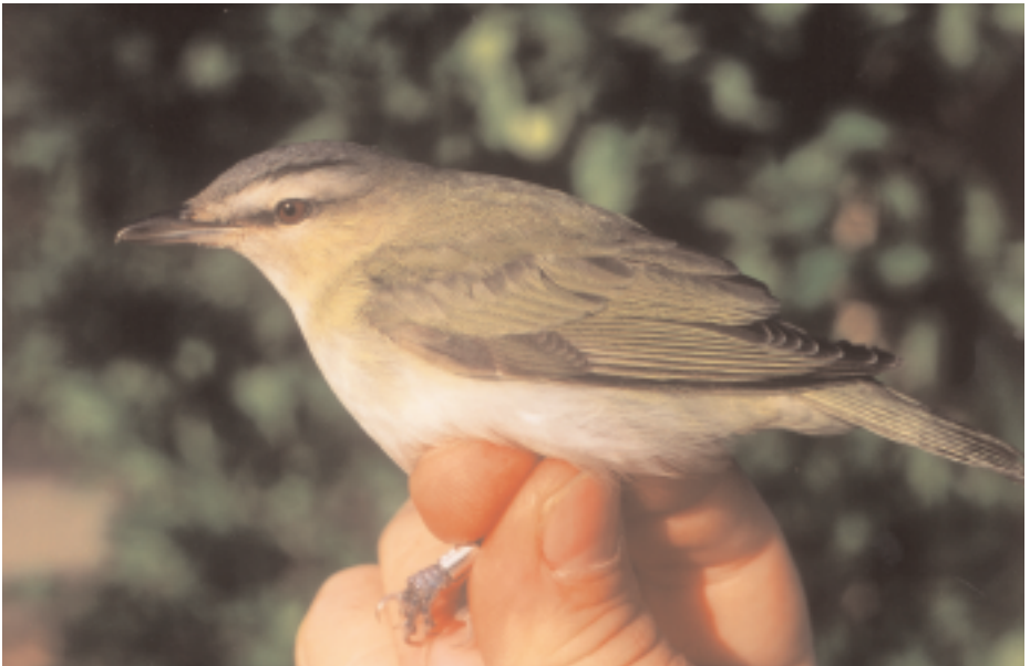
Viri d'ull vermell Vireo olivaceus , ca l'Andreu, Tiana (Maresme), 30.X (Gabriel Gargallo).