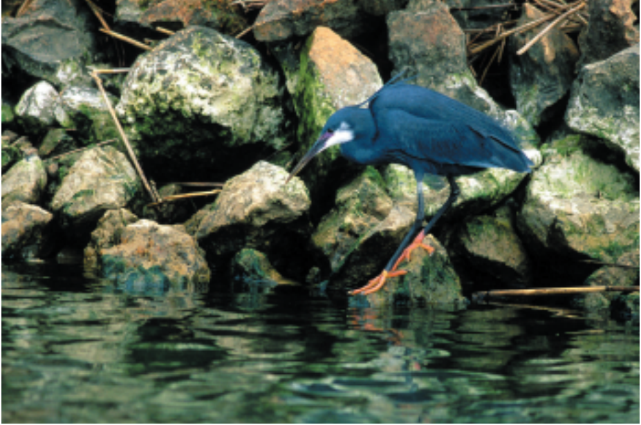
Martinet dels esculls Egretta gularis , Gola de Pal, la Marquesa, delta de l'Ebre (Baix Ebre), 19.V.