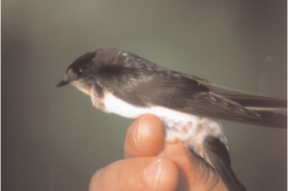
Híbrid Oreneta cuablanca x Oreneta vulgar Delichon urbica x Hirundo rustica , l'Encanyissada, delta de l'Ebre (Montsià), 9.IX (Raül Calderon).