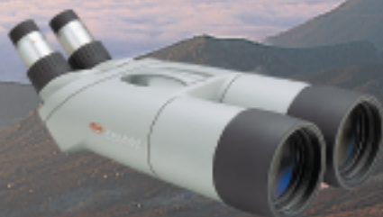
Highlander, prismático 82mm Ø