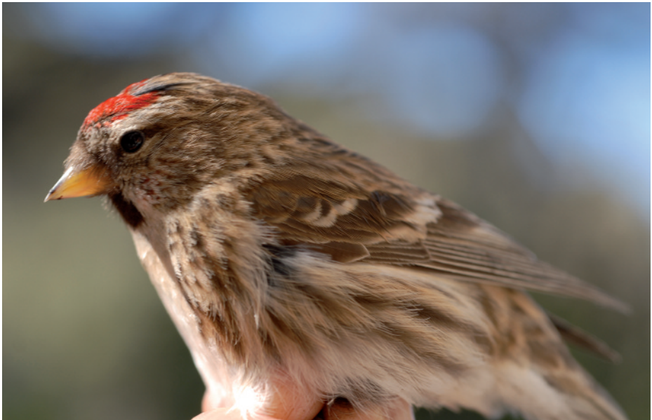
Passerell golanegre Carduelis flammea , embassament de Sant Ponç, Clariana de Cardener (Solsonès), 11.III.2008 (Josep Cabrera).