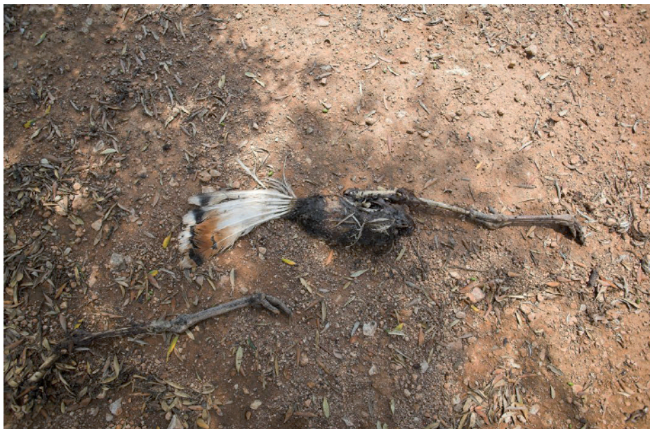
Restes de pic salvatge Otis tarda , ZEPA de la serra de Godall, Uldecona (Montsià), 25.VI.2008 (Xavier Parellada).