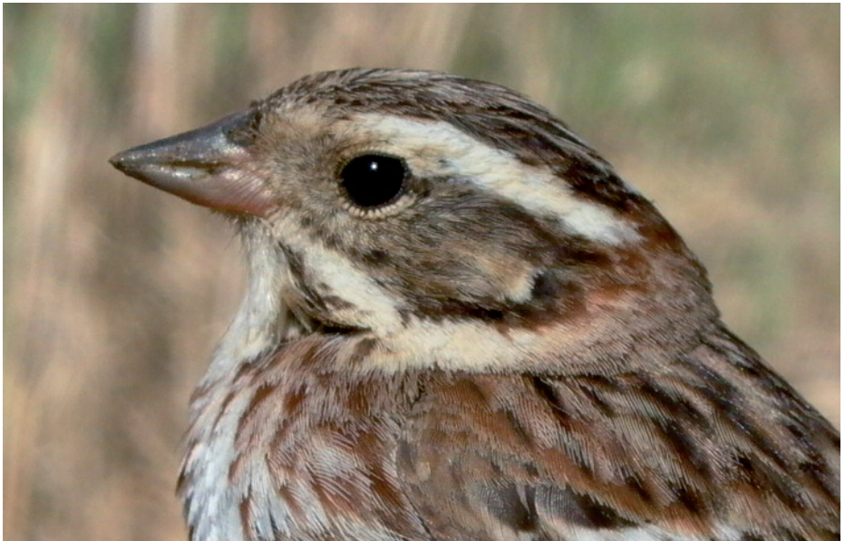
Repicalons rústic Emberiza rustica , illa de Buda, Delta de l'Ebre (Montsià), 18.III.2008 (Cristian Jensen).