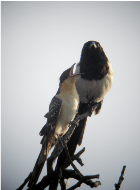
Cucut reial Clamator glandarius alimentat per una garsa Pica pica , bassa dels Alous, Rubí (Vallès Occidental), 30.VI.2008 (José Luis Romero).