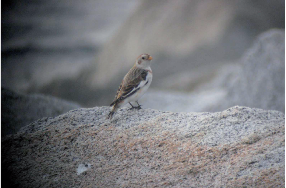
Sit blanc Plectrophenax nivalis , port d'Arenys de Mar, Arenys de Mar (Maresme), 7.I.2008.