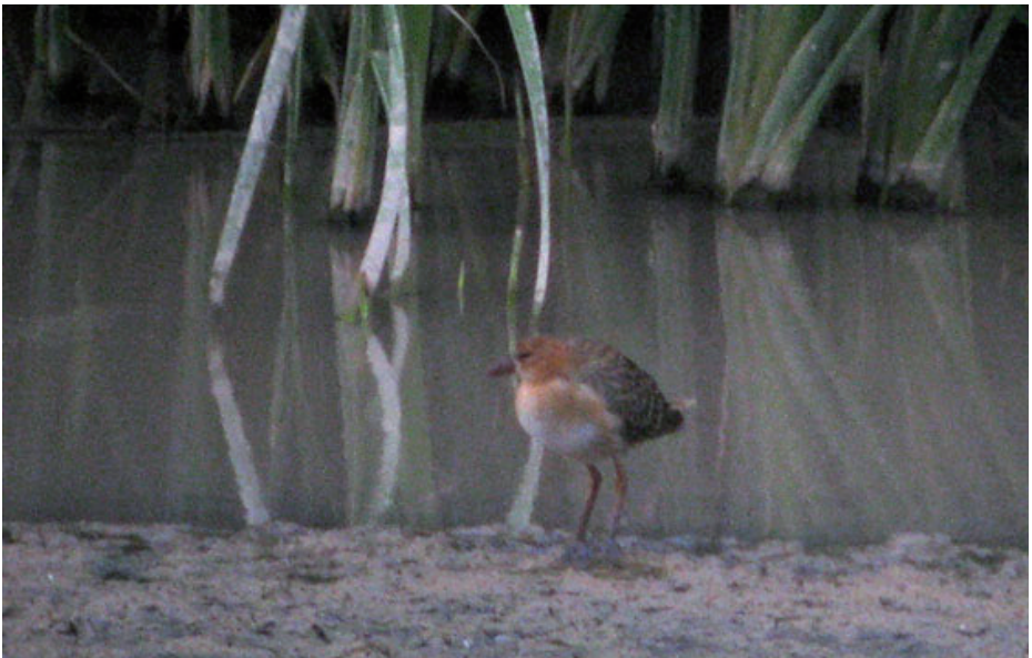
Polla blava d'Allen Porphyrio alleni , el Matà, Parc Natural dels Aiguamolls de l'Empordà (Alt Empordà), 13.VIII.2008.