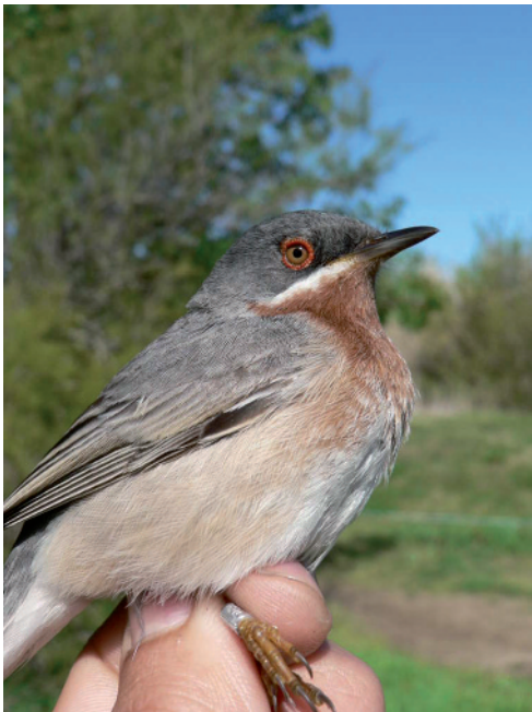
Tallarol de garriga Sylvia cantillans albistriata , estany de Mornau, Parc Natural dels Aiguamolls de l'Empordà (Alt Empordà), 23.IV.2008.