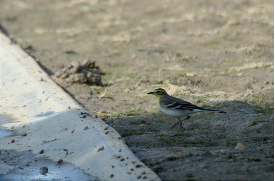
Cuereta citrina Motacilla citreola , Gualta, Gualba (Baix Empordà), 14.X.2008 (Àlex Ollé).