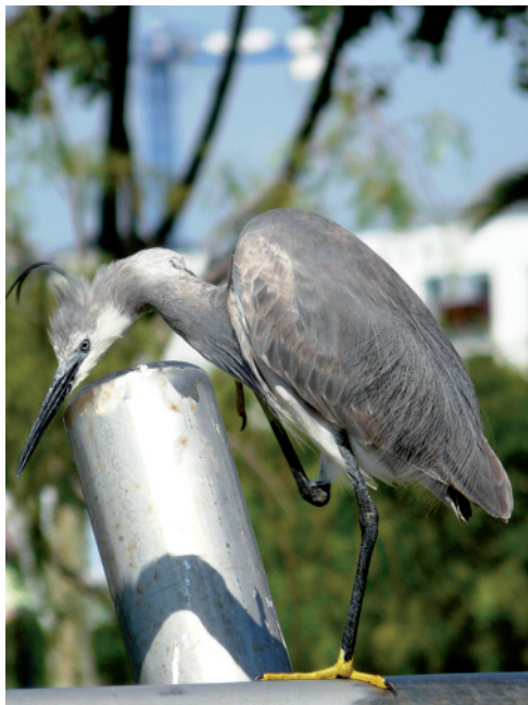
Martinet dels esculls x Martinet blanc Egretta gularis x Egretta garzetta , parc Diagonal Mar, Barcelona (Barcelonès), 8.VI.2008 (Ricardo Ramos).