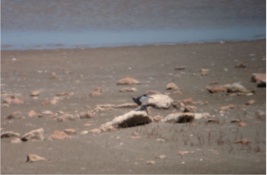
Xatrac Embridat Sterna anaethetus , punta de la Banya, delta de l'Ebre (Montsià), 18.VI.2008 (Manolo García).