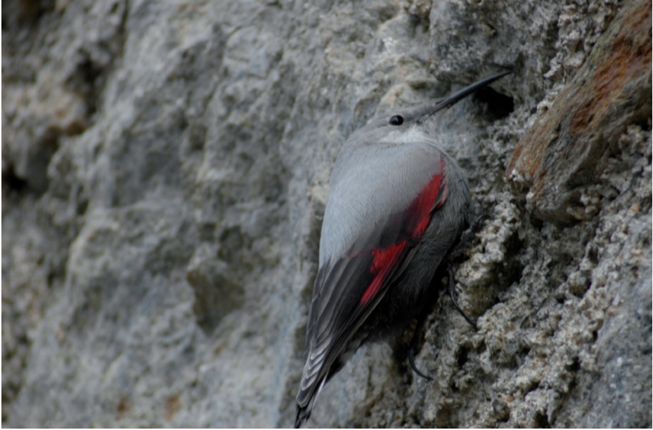
Pela-roques Tichodroma muraria , Bossòst (Val d'Aran), 19.XII.2008.