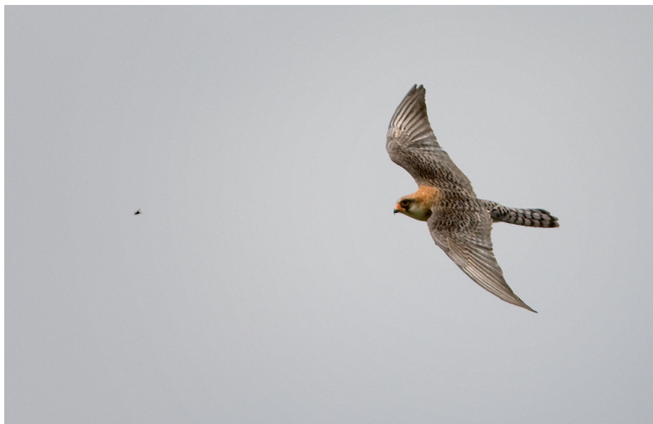
Falcó cama-roig Falco vespertinus , els Tres Ponts, Parc Natural dels Aiguamolls de l'Empordà (Alt Empordà), 8.V.2008 (Rafael Armada).