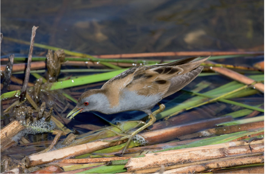
Rascletó Porzana parva , Riet Vell, delta de l'Ebre (Montsià), 23.III.2008 (Jordi Rojals).