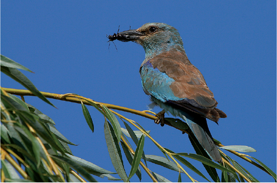
Gaig blau Coracias garrulus , les Planes, Santpedor (Bages), 2.VIII.2008 (Xavier Burgos).