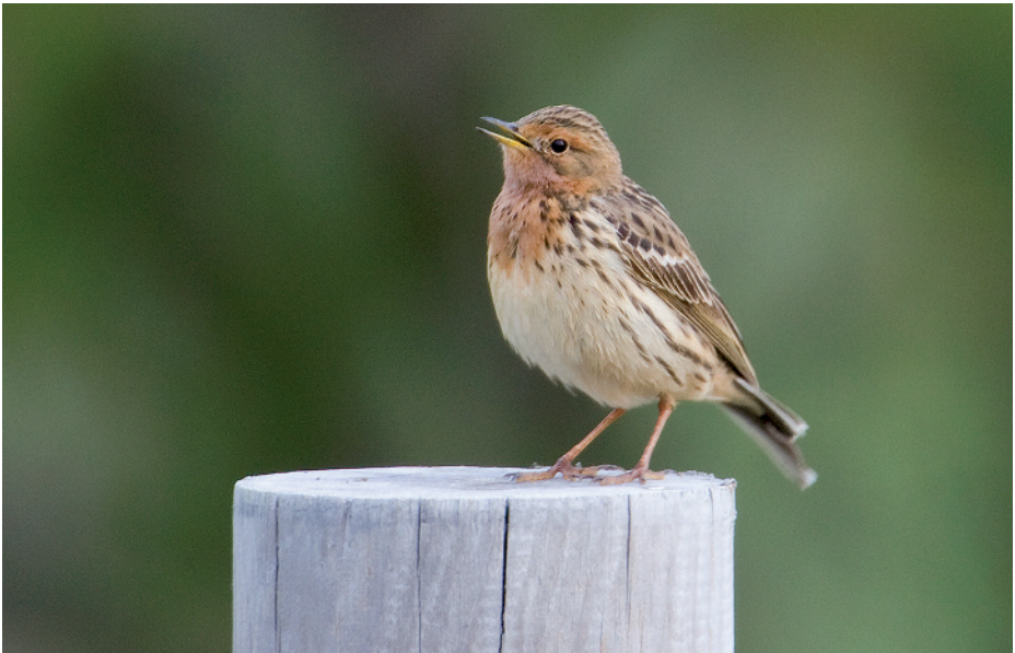
Piula gola-roja Anthus cervinus , el Matà, Parc Natural dels Aiguamolls de l'Empordà (Alt Empordà), 8.V.2008 (Rafael Armada).