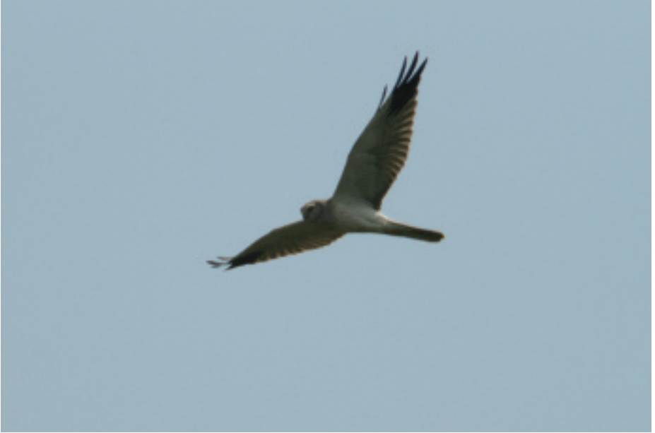
Arpella pàl·lida russa Circus macrourus , Delfià, Rabós (Alt Empordà), 29.III.2007 (Àlex Ollé).