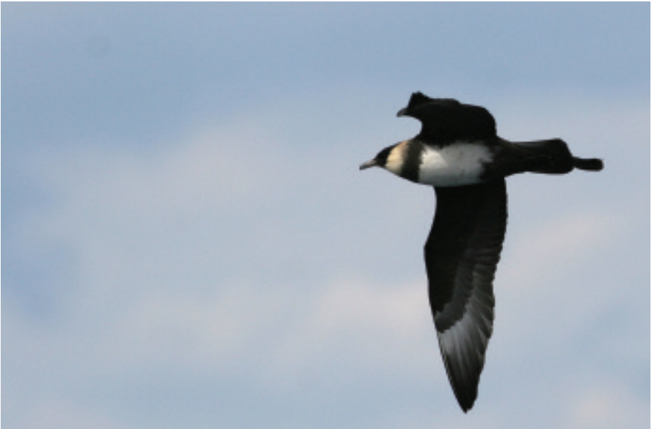
Paràsit cuaample Stercorarius pomarinus , Tarragona (Tarragonès), 2.V.2007 (Albert Cama).