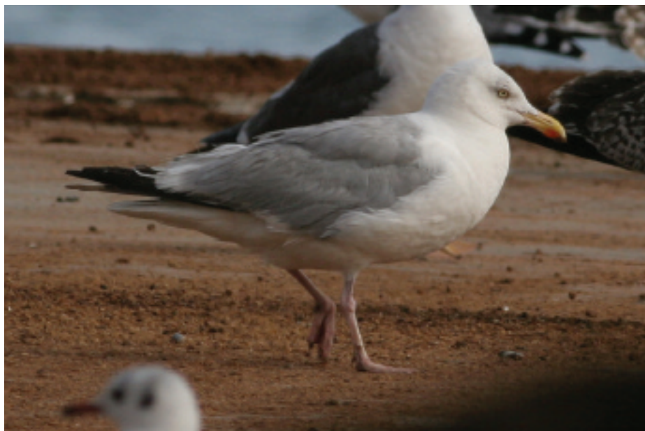
Gavià argentat de potes roses Larus argentatus , port de Tarragona, Tarragona (Tarragonès), 25.VIII.2007 (Albert Cama).