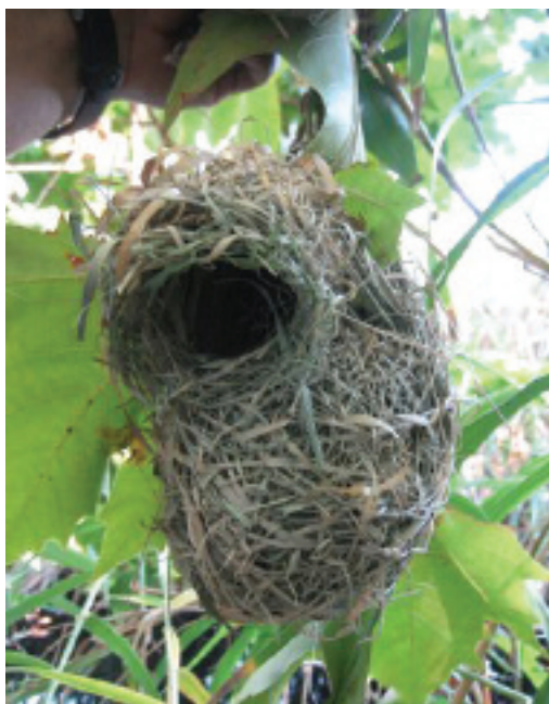
Niu de Teixidor capnegre Ploceus melanocephalus , desembocadura de la Tordera, Malgrat de Mar (Baix Empordà), 23.X.2007 (Xavier Romera).