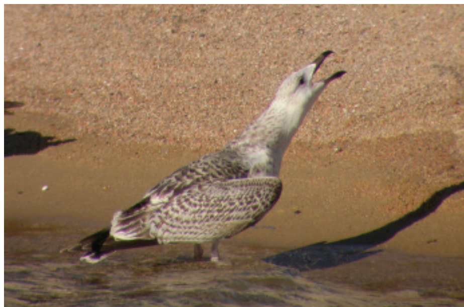
Gavinot Larus marinus , port de Palamós, Palamós (Baix Empordà), 27.I.2007 (Pedro Serrano).