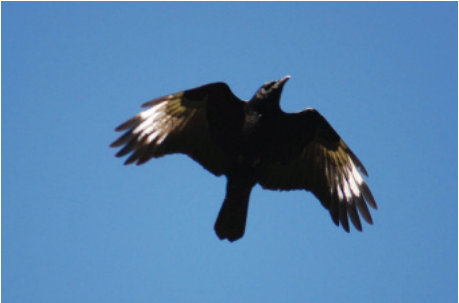
Cornella Corvus corone , Bernui, Sort (Pallars Sobirà), 1.VII.2007 (Job Roig).