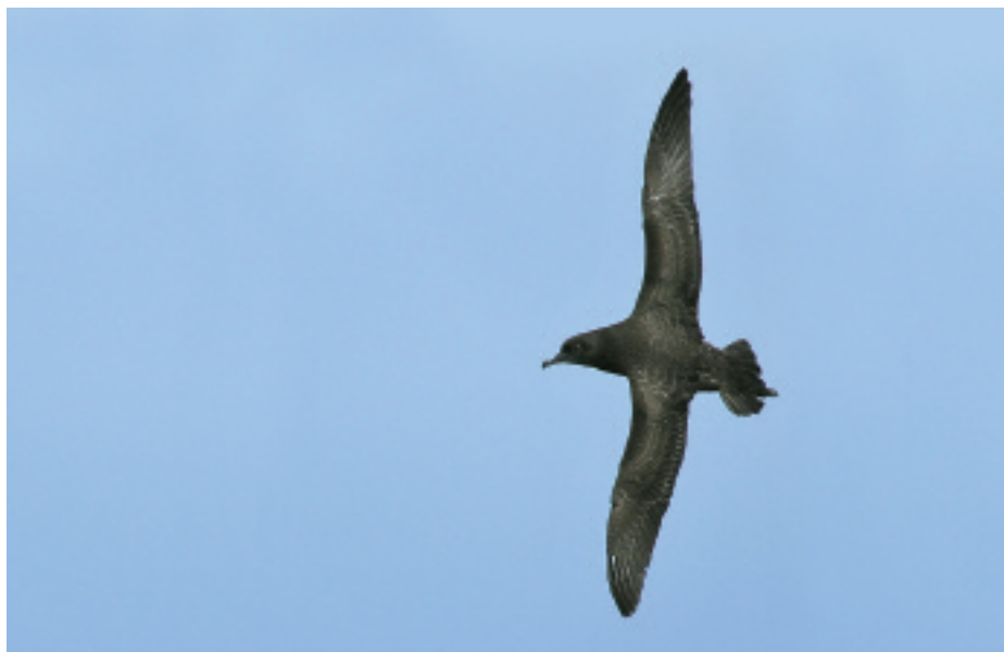
Baldriga grisa Puffinus griseus , cap Norfeu, Parc Natural de Cap de Creus (Alt Empordà), 31.III.2007.