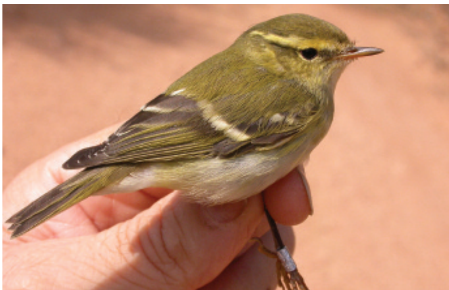
Mosquiter de doble ratlla Phylloscopus inornatus , Montblanquets, La Palma d'Ebre (Ribera d'Ebre), 7.X.2007.