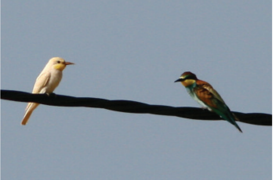
Abellerol Merops apiaster , puig dels Jueus, Vic (Osona), 5.VIII.2007 (Rubén Gutiérrez).