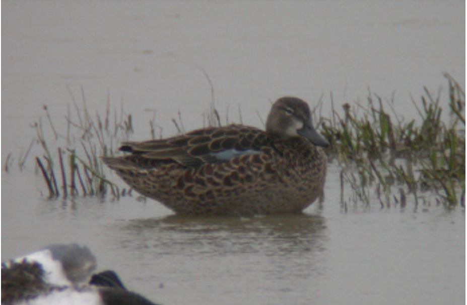
Xarxet Alablau Anas discors , el Remolar, delta del Llobregat (Baix Llobregat), 14.IV.2007 (Pedro Bescós).