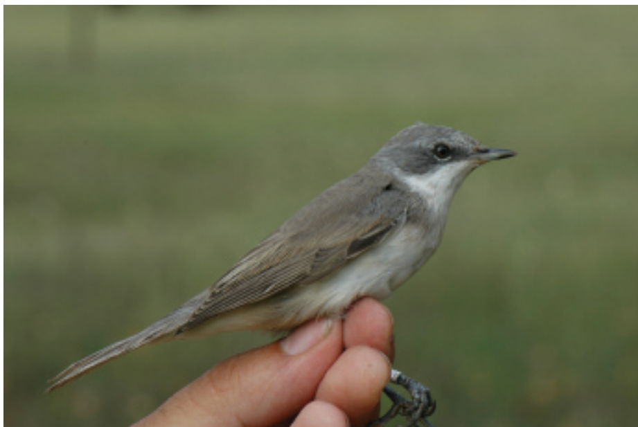
Tallarol xerraire Sylvia curruca , Salt (Gironès), 15.IX.2007 (Miquel Boix).