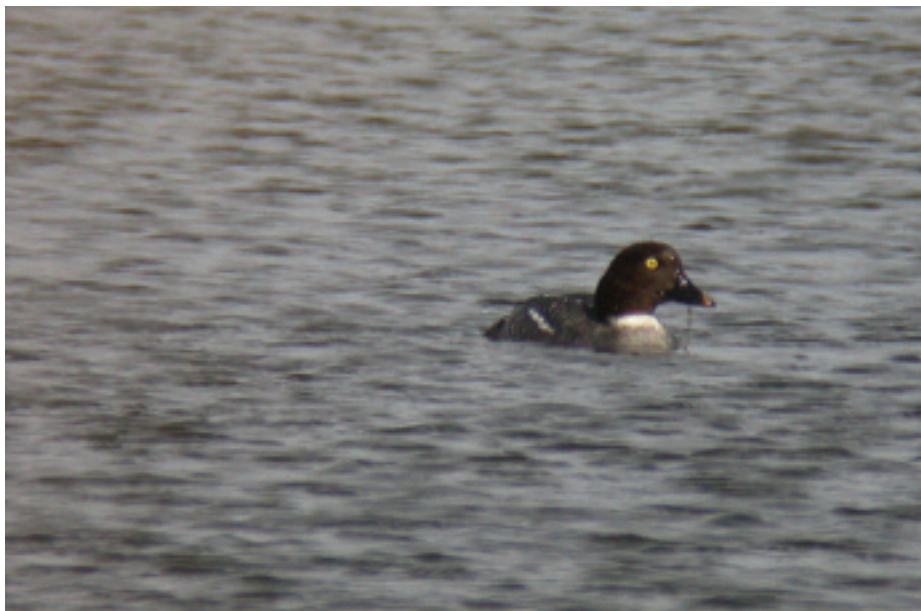
Morell d'ulls grocs Bucephala clangula , llacuna de cal Tet, delta del Llobregat (Baix Llobregat), 24.II.2007 (Pedro Bescós).