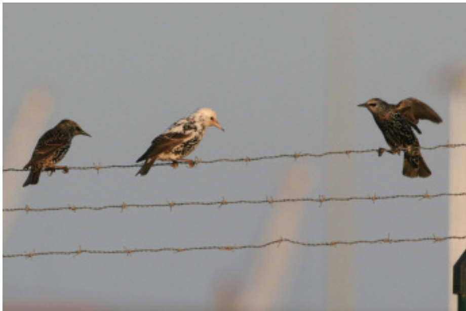
Estornell vulgar Sturnus vulgaris , planta de transvasament de residus, Viladecans (Baix Llobregat), 28.X.2007 (Albert Cama).