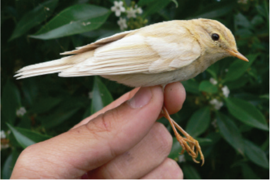
Mosquiter de passa Phylloscopus trochilus , Canal Vell, Delta de l'Ebre (Baix Ebre), 25.IV.2007 (Jordi Feliu).