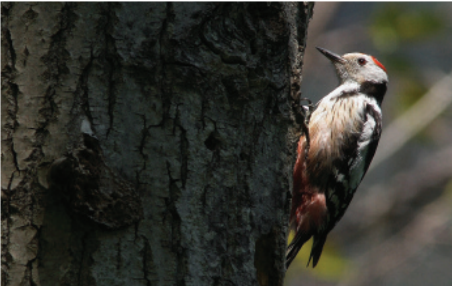
Picot garser mitjà Dendrocopos medius , Bausen (Val d'Aran), 9.V.2007 (Julio Pérez).